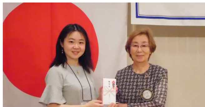
米山奨学金 6月7月分授与