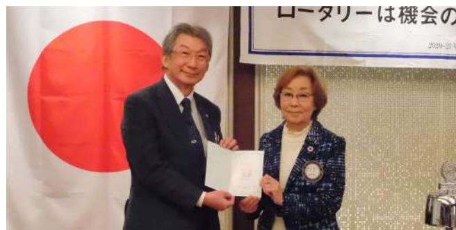
ロータリー米山記念奨学会より廣内会員へ第4回目感謝状