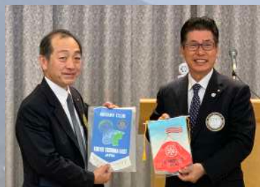
2クラブ会長によるバナー交換