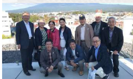
富士山世界遺産センターにて