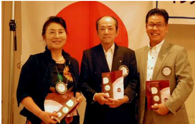
10月の誕生日祝会員