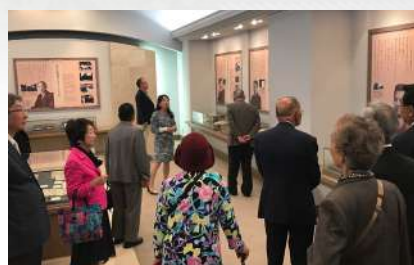
米山梅吉記念館・資料館見学